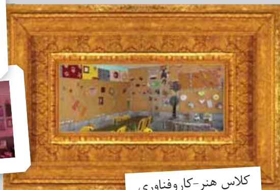
کلاس هنر- کاروفناوری